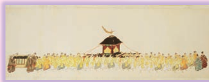
写真：県指定文化財 氷川神社行幸絵巻（氷川神社蔵、部分）