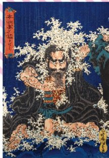
歌川国貞画 本朝高名鑑 文賢上人