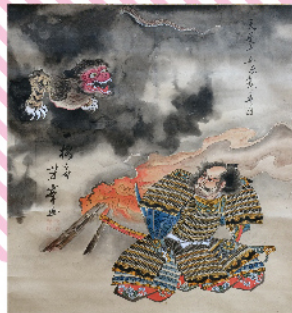
歌川芳華筆 額政義過治(左幅)