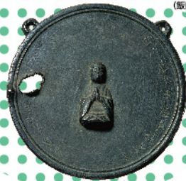
埼玉県指定文化財 磨仏