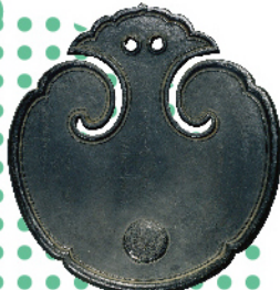
重要文化財 圓板 (飯能市・長光寺蔵)