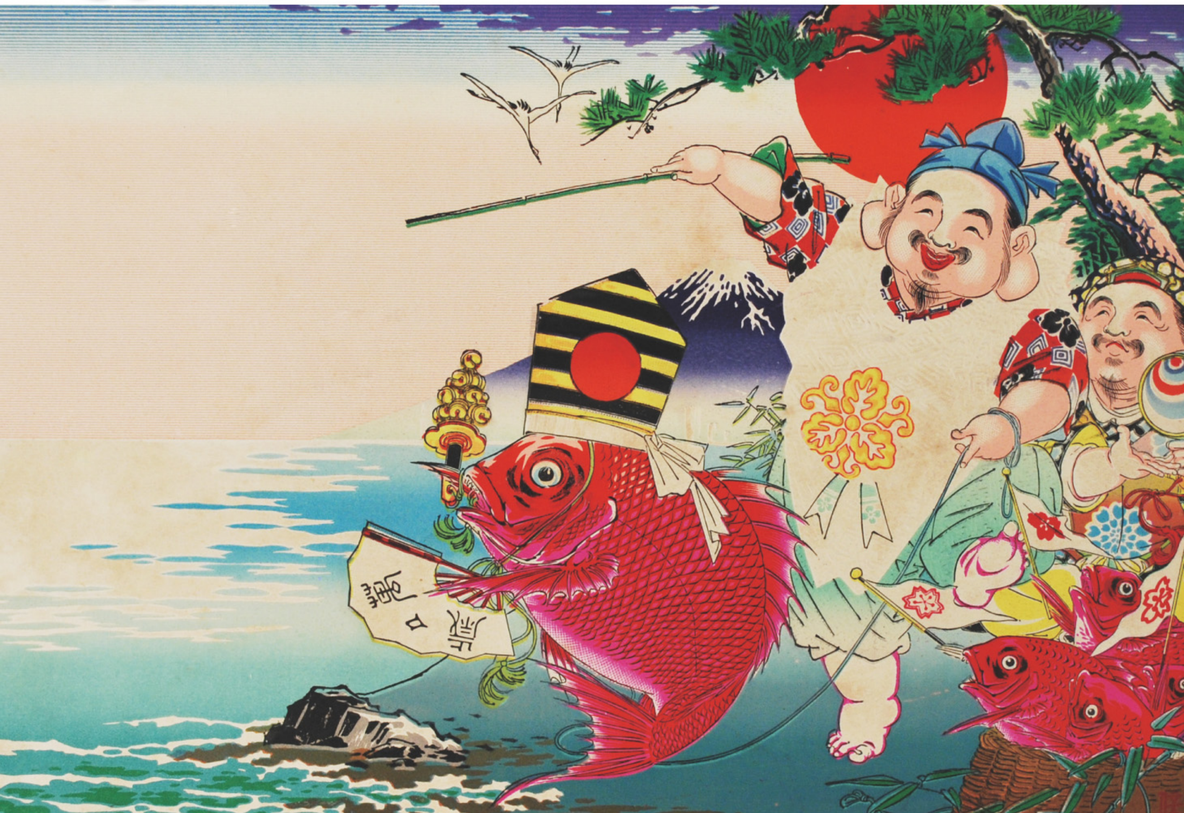
引礼見本「鯛の三番受と恵比須大黒」(当館蔵、部分)