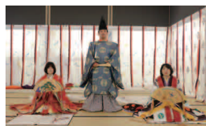
十二単・小桂と男子装束の着装体験