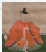
旗本水野忠貞画像 (寄居町 昌国寺蔵)

新型コロナウイルス感染症拡大防止に伴い公開が叶わなかった展覧会、特別展「武蔵国の旗本」について、館蔵・寄託資料を中心に展覧会の内容を振り返ります。