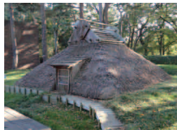
弥生時代復元住居