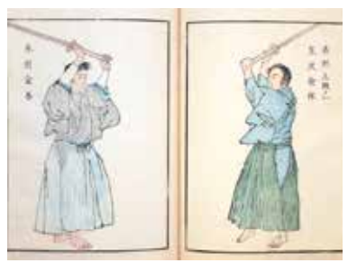
皇国武術英名録 三より

武術・武道は、日本の運動文化を体現する無形の文化遺産です。江戸時代中期以降、埼玉県域でも本格的な武術指導を行う諸流派が登場し、多くの人々が入門しました。剣術・柔術を中心とする、埼玉県ゆかりの武術諸流派や歴史上に名をのこした武者などを紹介します。