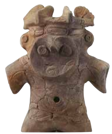
小林八束1遺跡出土 土偶(埼玉県教育委員会蔵)

埼玉県では、約3万5千年前の旧石器時代から近代に至る、数多くの遺跡がこれまでに調査されてきました。そこで出土した、埼玉の歴史を考える上で欠くことのできない考古資料を厳選してご紹介します。また、現在は県外の博物館等に所在している資料の一部も「里帰り」します。