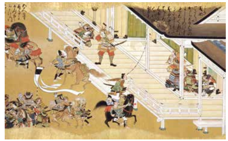
太平記絵巻巻第七より

太平記絵巻は、長大な軍記物語『太平記』を全12巻の絵巻にした現存する唯一の作品です。全12巻のうち、当館が所蔵する巻第一、二、六、七、十巻を17年ぶりに一挙に展示・公開します。華麗な太平記絵巻の魅力をお楽しみください。