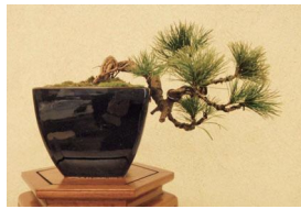
大宮盆栽村 盆栽 ※写真はイメージです。