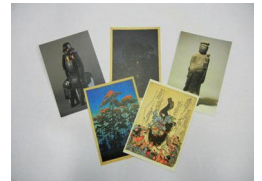
埼玉県立歴史と民俗の博物館 オリジナルポストカード (5枚組み)