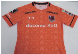
大宮アルディージャ 「レプリカユニフォーム」 ※サイズは選べません。写真はイメージです。