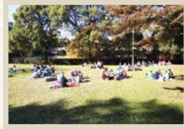
博物館に隣接する大宮公園 百年の森での昼食風景

※①②ともに駐車場入口が狭いため、バックで駐車場へお入りください。また、②を御利用いただく場合は、産業道路方面からお越しください。