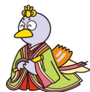
埼玉県のマスコットコバトン

日 時 2024年1月13日(土) ※ 時間は参加者決定時に当館からお知らせ致します。 また、体験開始時間は若干前後する可能性があります。 ① 9:30～ ② 10:30～ ③ 11:30～ ④ 12:30～ ⑤ 13:30～ ⑥ 14:30～ (各回1名) 会 場 ゆめ・体験ひろば『自由自在座』 定 員 A 十二単・小袿 …小学生以上 4名 ※小中学生は小袿、高校生以上は十二単の着装になります。 B 男子装束 …高校生以上 2名 費 用 1,000円