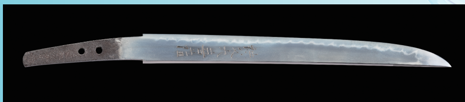
短刀 銘 備州長船住景光(謙信景光) 国宝 当館蔵

景光(かげみつ)が制作し、後世、上杉謙信(うえずぎけんしん)が所持したことから、「謙信景光(けんしんかげみつ)」と呼ばれる