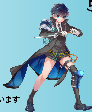
刀剣男士 謙信景光