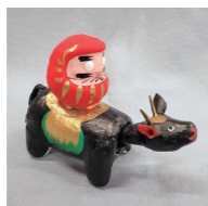
牛乗りダルマ(当館蔵)