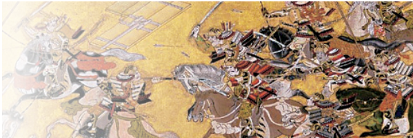
源平合戦図屏風(部分)