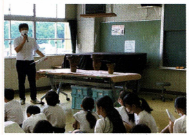
時代ごとの土器の解説

対象：小学校6年生・中学校1年生 実施時期：4月～12月 時間：45分×クラス数