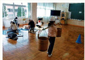
昔の道具の体験活動