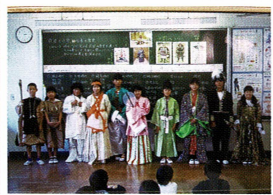
縄文～明治の着装風景