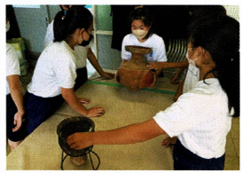
土器の観察をする子どもたちの様子