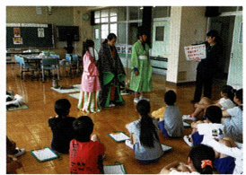
時代ごとの衣装の解説

対象：小学校6年生・中学校1年生 実施時期：4月～12月 時間：45分×クラス数