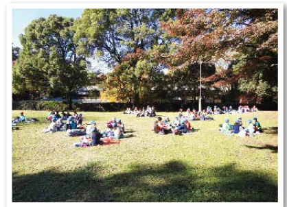
大宮公園百年の森での昼食風景

※雨天時、百年の森が使えない時の館内における昼食場所につきましては、学習支援担当(048-645-8171)までお問合せください。