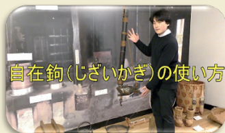
自在鉤(じざいかぎ)の使い方