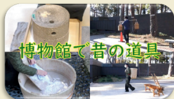
博物館で昔の道具