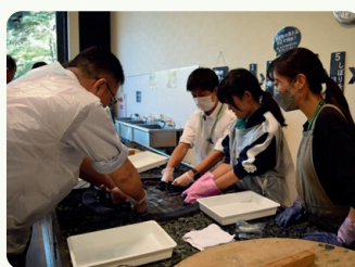
藍染めハンカチづくり体験