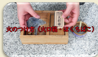
火のつけ方(火口箱・ぼくちぼ)

見学の事前学習、教室での調べ学習などにご活用ください。 新しい動画を随時アップロードしていきます！