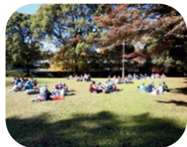
大宮公園百年の森での昼食風景